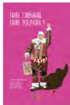
Close, C., Istasse, M., Maskens, M. & Verlinden, E. (eds), Faire carnaval, faire politique ? : Editions de l'UO, 2023.