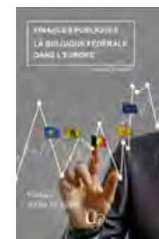
G. Pagano, Finances publiques, La Belgique fédérale dans l'Europe , Charleroi : Éditions de l'UO, 2021.