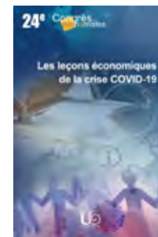
Les leçons économiques de la crise COVID-19, Actes du 24 e Congrès des économistes (2019). Editions de l'UO, 2023.