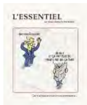
Magnoni, L. & Verhoeven, T., L'Essentiel, un pied dans la trentaine : Editions de l'UO Charleroi, 2022.